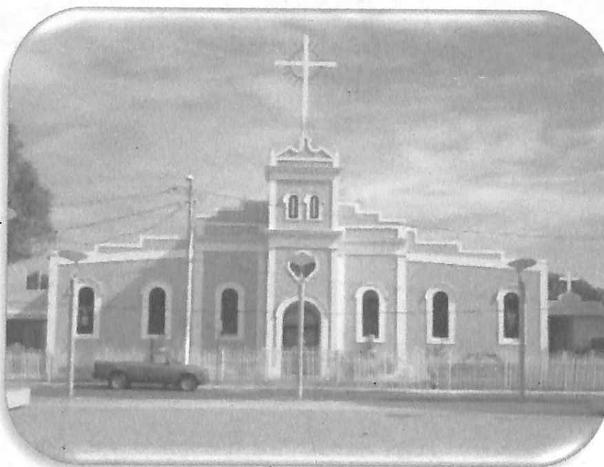
Archivo de la Parroquia La Monserrate de Salinas (APMS) Sergio A. Rodríguez Sosa